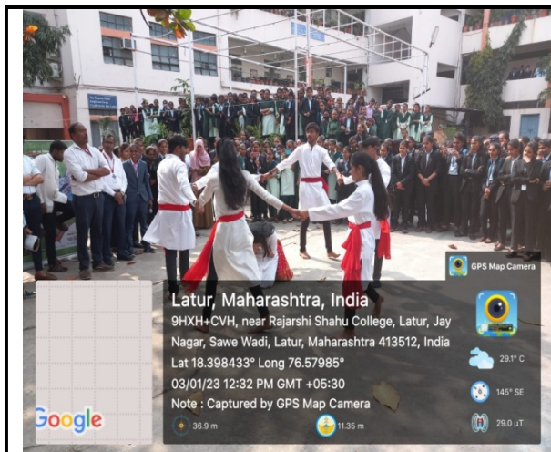
The students of the N.S.S. department were enlightened on the burning issues of today's women through street drama in jayanti program.